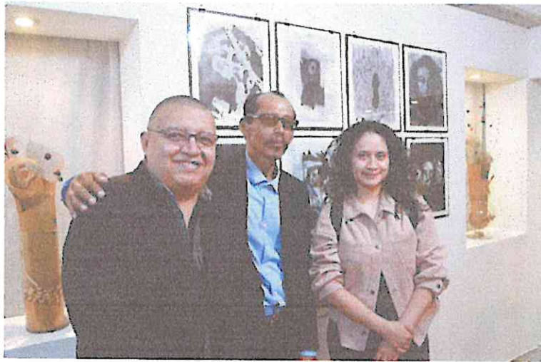
Compartiendo con colegas artistas.